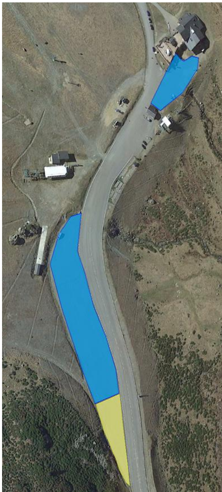
Annexe 3: Zones réglementées hors saison d'hiver